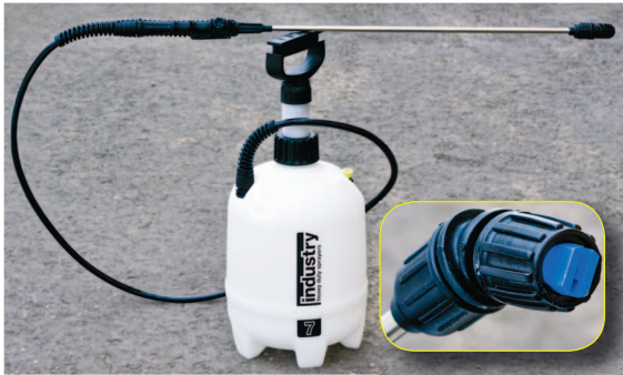
Geelpumppu, 7 litraa T.nro 3237

Käytä levittämiseen geeli-pumppua. Pumpun suutin muodostaa riittoisan, vaahdomaisen hyvin tarttuvan käyttöseoksen.